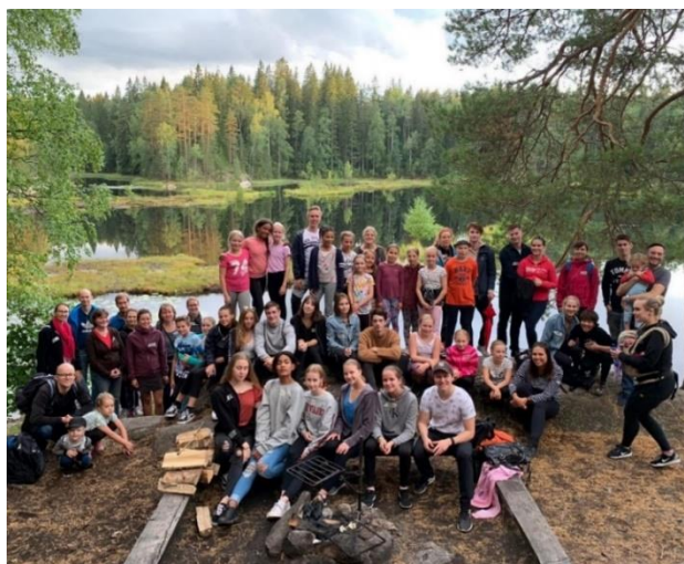
Jäätanssijat Nuuksiossa elokuussa 2019