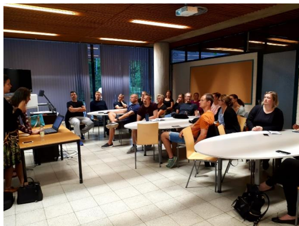
ISU-pistelaskentajärjestelmän koulutus elokuussa 2019