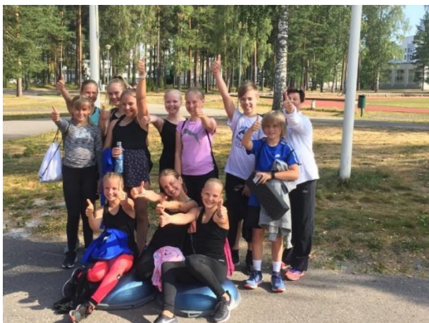
R2 leiriläiset Vierumäellä heinäkuussa 2019

Toimikunta osallistui kauden aikana kilpailutapahtumien järjestämisen lisäksi mm. seurakuvauksen organisointiin yhteistyössä OmaDesign Oy:n kanssa sekä seuravaatteiden hankinnan organisointiin. Kaudella 2019–2020 järjestettiin lisäksi kilparyhmä 2:n leiri Vierumäellä 29.7.-2.8.2019, Halloween- ja kirpputoritapahtuma 3.11.2019, luisteliijoille ja vanhemmille suunnattu, Mia Laakson pitämä ravintoluento 12.12.2020 ja kaikille aktiivisille seuratoimijoille tarkoitettu, Kirsi Larjamon pitämä ISU-pistelaskentajärjestelmän koulutus 14.8.2019. Kevään 2020 näytös-ohjelmakilpailu jäi toteutumatta koronapandemian vuoksi. Lisäksi yksinluistelutoimikunta osallistui yhdessä muiden toimikuntien kanssa seuran muiden tapahtumien valmisteluihin.